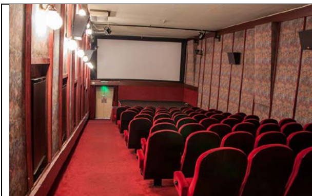
Kino Cafe mozi nagyterem, hétköznap: 35-70 000 Ft+ÁFA / 2óra