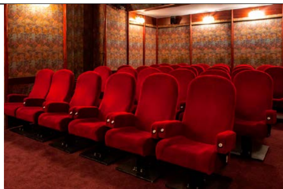
Kino Cafe mozi kisterem, hétköznap: 20-30 000 Ft+ÁFA / 2óra