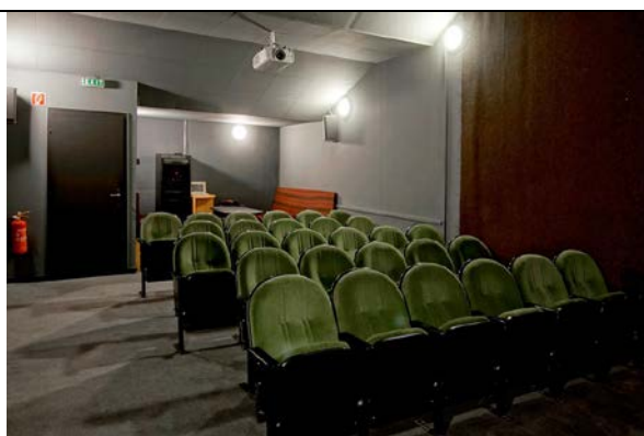
Tabán mozi Fellini terem, hétköznap: 20-30 000 Ft+ÁFA / 2óra

A hétvégi szabad időpontok korlátozottak, a bérleti díj adott esetben magasabb a hétköznapokra vonatkozó árnál.